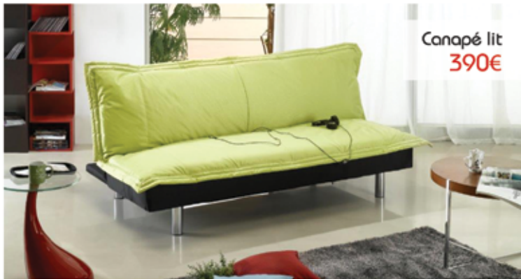
Canapé lit 390€