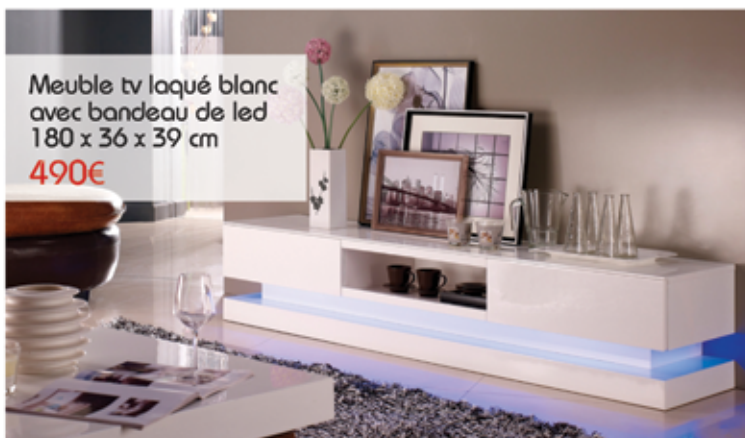
Meuble tv laqué blanc avec bandeau de led 180 x 36 x 39 cm 490€