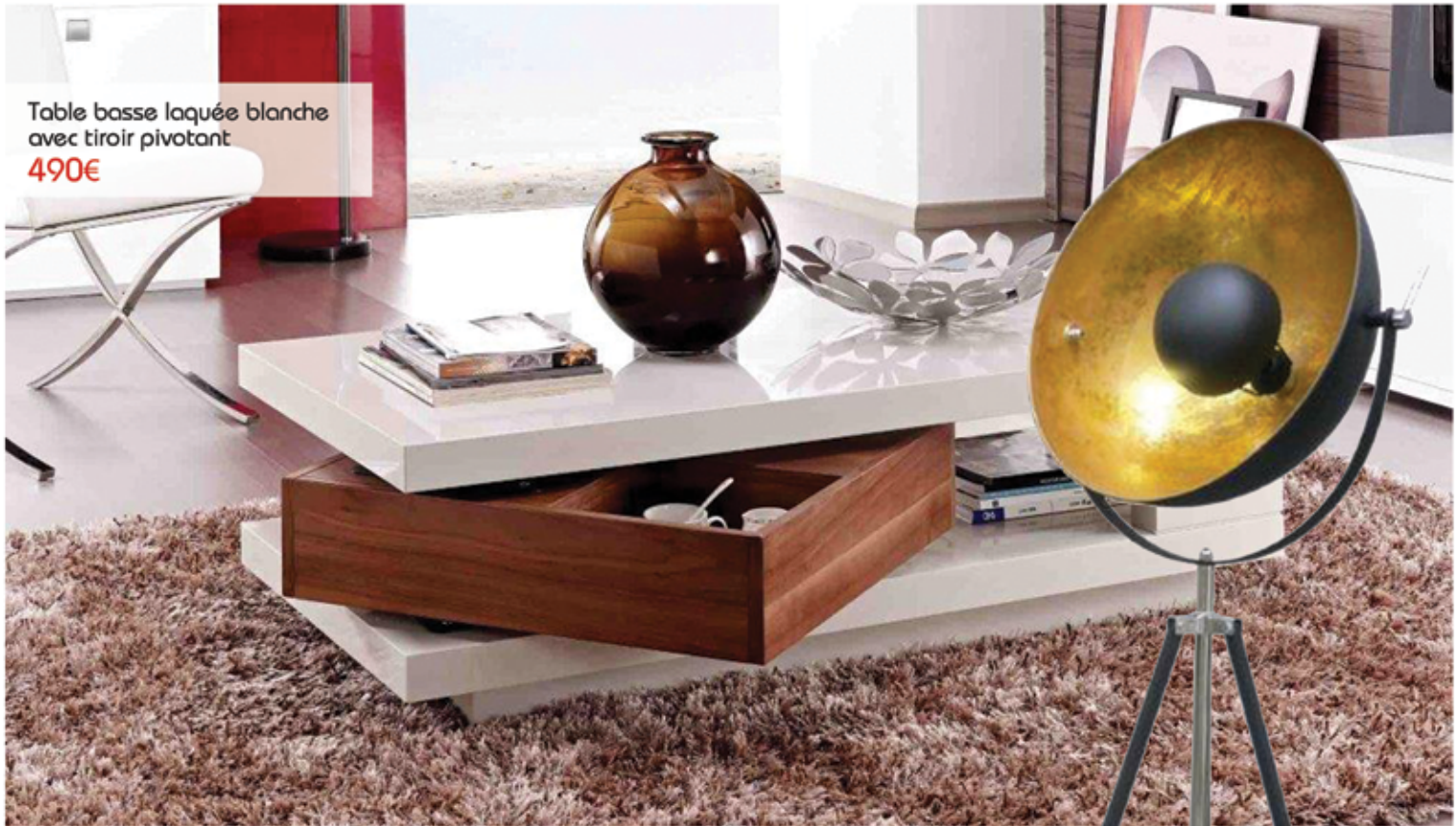
Table basse laquée blanche avec tiroir pivotant 490€