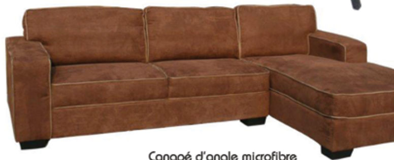
Canapé d'angle microfibre 270 x 150 cm 990€