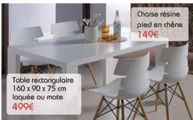
Table rectangulaire 160 x 90 x 75 cm laquée ou mate 499€