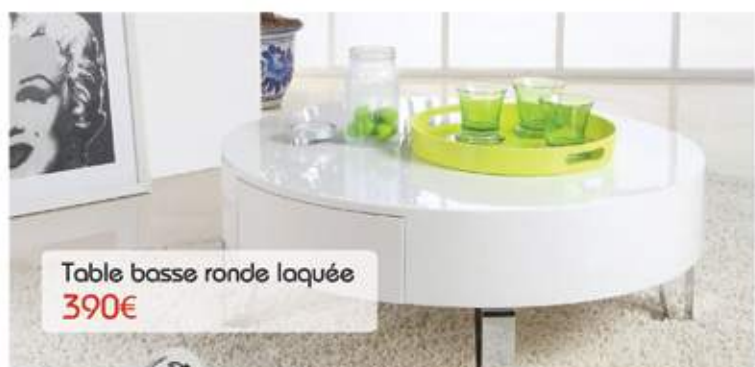
Table basse ronde laquée 390€

Canapé d'angle convertible 270 x 160 cm 990€