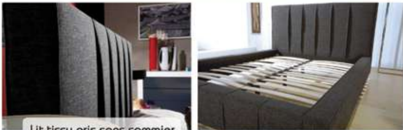
Lit tissu gris sans sommier 150x200 cm 690€