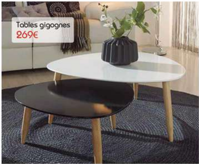
Tables gigognes 269€