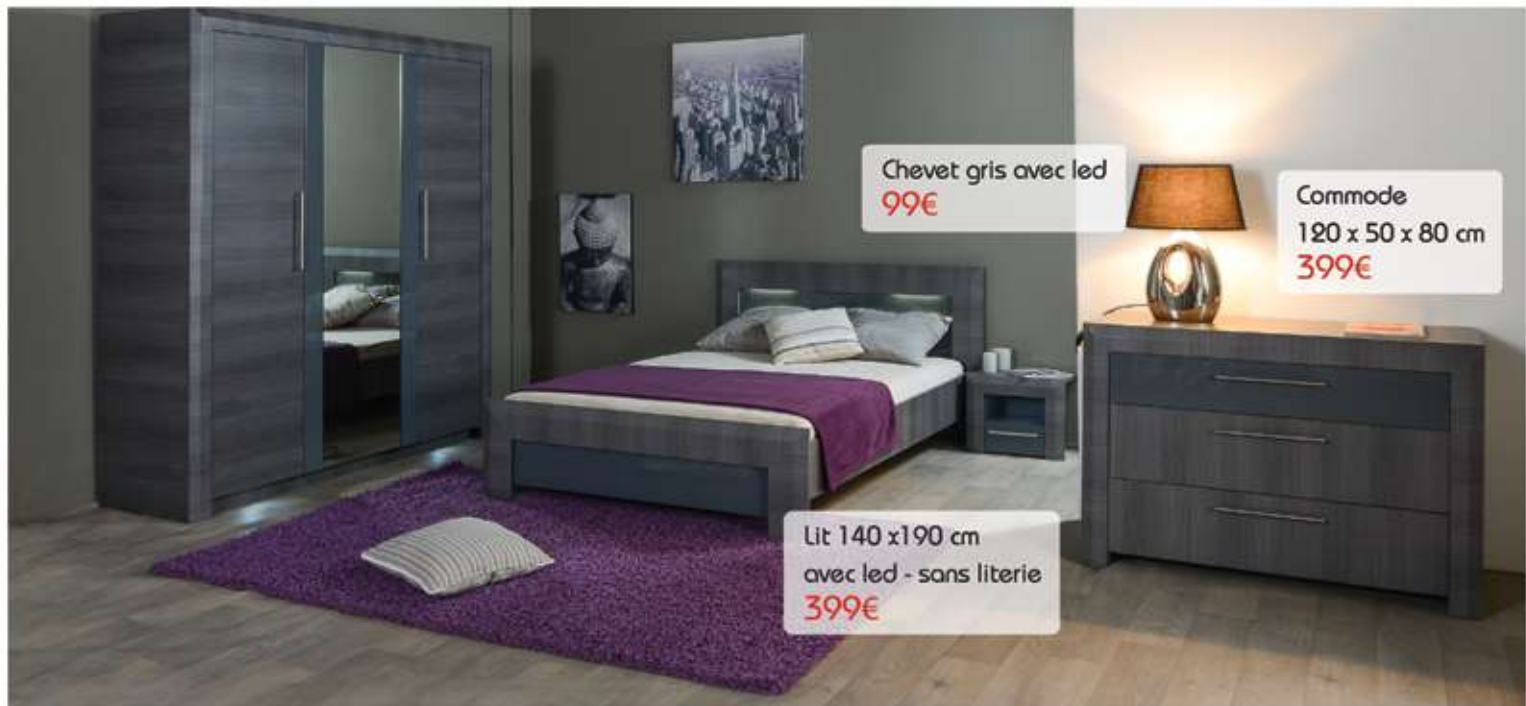
Chevet gris avec led 99€