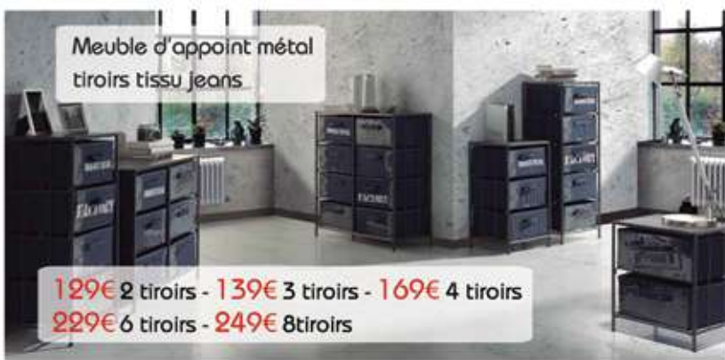
Meuble d'appoint métal tiroirs tissu jeans